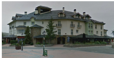
Nuestro guarda esquís en Pradollano