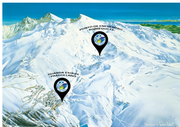
Nuestro punto de encuentro en Borreguiles