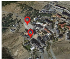
La parada del autobús en Pradollano