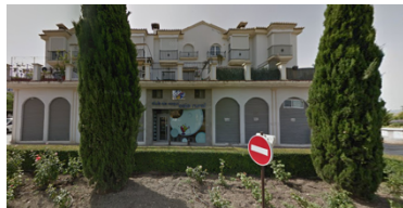
La sede de nuestro Club en Granada